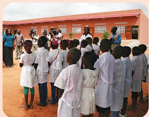
Reinício da actividade lectiva será sob regras apertadas