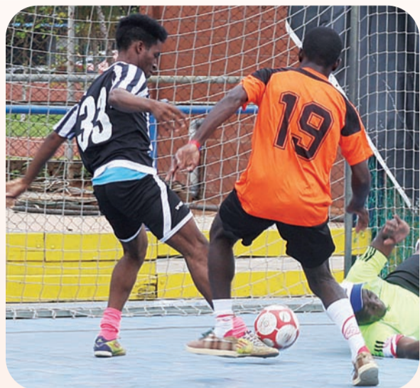
EDUARDO PEDRO | EDIÇÕES NOVEMBRO

3.1 Previsão de reinício da actividade desportiva (dependente da evolução da situação epidemiológica):