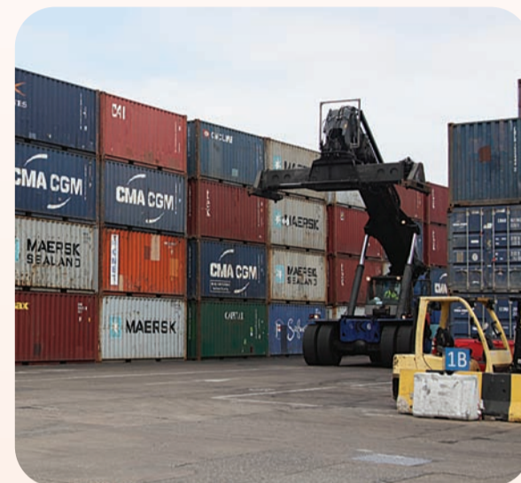
CONTREIRAS PIPA | EDIÇÕES NOVENBRO