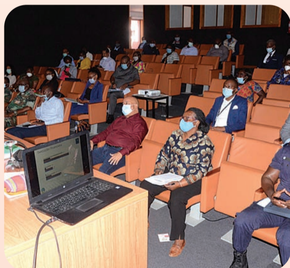
ARÃO MARTINS | EDIÇÕES NOVENBRO