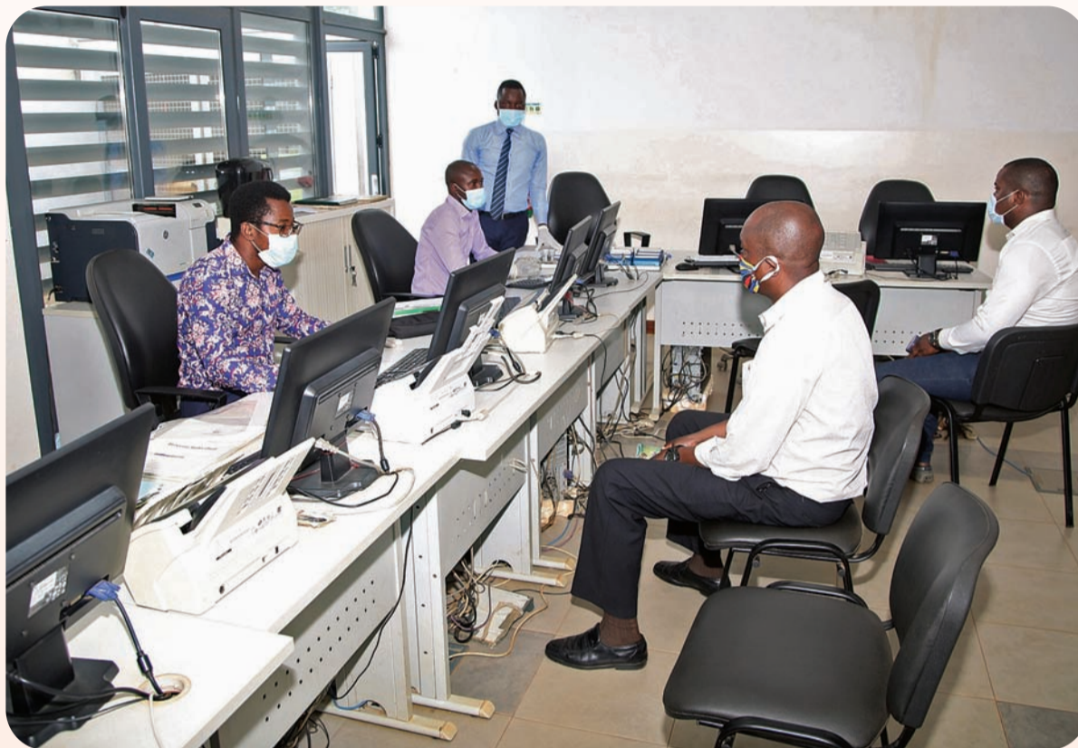
GARCIA MANATOKO | EDIÇÕES NOVEMBRO