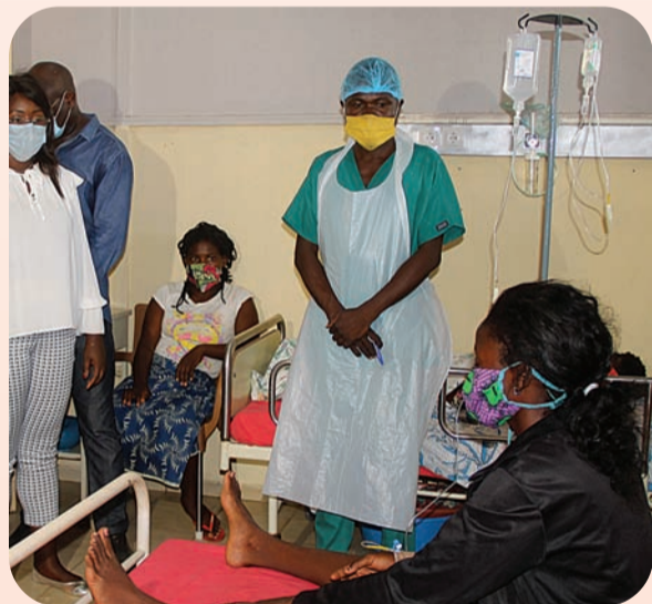
EDMUNDO EUGLIO | EDIÇÕES NOVEMBRO

12.1 Previsão de reinício das visitas aos estabelecimentos hospitalares (dependente da evolução da situação epidemiológica):