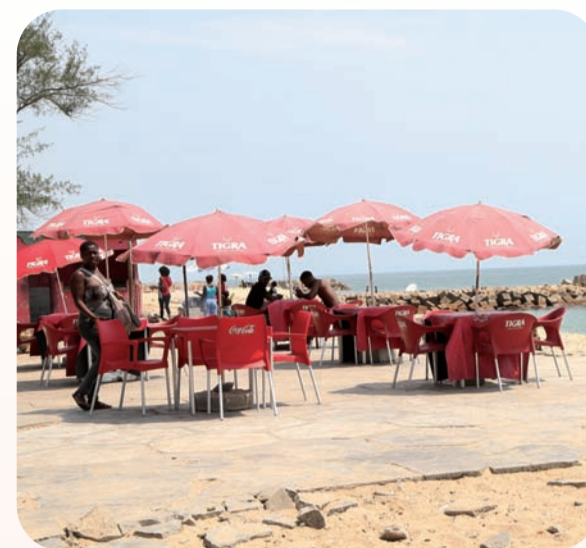
JOSE COLA | EDIÇÕES NOVEMBRO