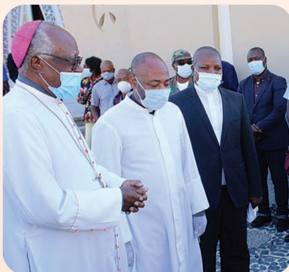
ARÃO MARTINS | EDIÇÕES NOVENBRO