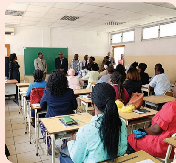
Instituições devem criar condições para voltar a funcionar