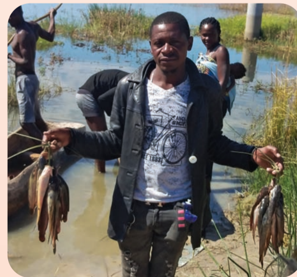
DOMINGO CALUGIPA | EDIÇÕES NOVEMBRO